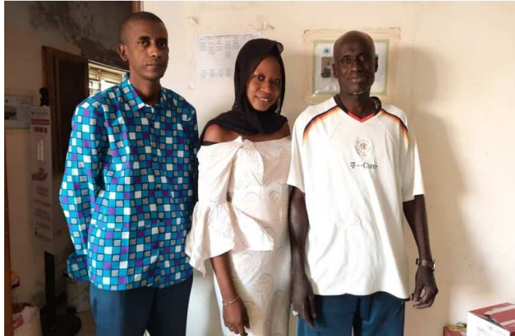
Equipe technique du projet Bokk Yakaar

L'épidémie du VIH au Sénégal est de type concentré, avec une prévalence basse dans la population générale, âgée de 15-49 ans, qui s'établit à 0,3 % (Plan Stratégique National de lutte contre le SIDA 2018-2022). Cette prévalence cache beaucoup de disparités dans le pays avec les populations clés très touchées (5,5% chez les professionnelles du sexe, 27,6% chez les HSH et 9,4% chez les usagers de drogue injectable. La région de Fatick reste au-dessus de la moyenne nationale avec un taux de prévalence de 0,4%.