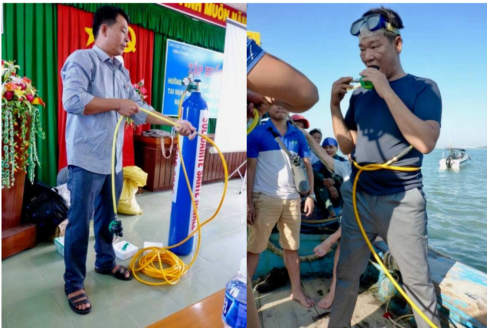
Formation théorique au Centre