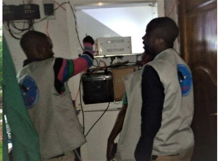
Centre de santé de MALINDE

Le territoire de Fizi est l'une des régions de l'Est de la république démocratique du Congo, jadis le théâtre de plusieurs conflits armés, qui aujourd'hui présente une situation de vulnérabilité socio-économique sans précédent pour les populations locales.